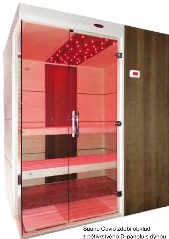
Saunu Cuvio zdobí obklad z pětivrstvého D-panelu s dýhou.

Vývojovou dílnu, výrobní závod a vzorkovnu najdete ve Vitiněvsi u Jičína, další prodejny v Praze a v Brně. Společnost se zabývá kompletní výrobou saunových kabin, infrakabin, saunového nábytku a dodávkou dalšího příslušenství, jako topidel, doplňků nebo ochlazovacích kádí. Základním materiálem je severský smrk, dovážený z Finska, a osvědčený topol, „lahůdkové“ sauny jsou z exotických dřev, z thermoosiky, thermoborovice, hemlocku nebo cedru. Firma používá také speciální pětivrstvý D-panel z Rakouska, s dýhou z různých druhů dřev, která dodá kabinám zcela originální styl a vzhled. Specifikem je vodorovné uložení palubkového obkladu a jedinečná panelová konstrukce saunových kabin, která umožňuje využít každý centimetr prostoru. Specialitou jsou bezrámové skleněné dveře zbrúšené pod úhlem 45°, což umožňuje precizní detaily i minimalizuje ztráty energie. Zákazníci často využívají spojení relaxace v teple s muzikoterapií a s požitkem z barev. Sauny jsou ovládány regulacemi RTS vlastní výroby, stejně jako infrakabiny s infračerveným prohříváním, s nimiž se ve světě začalo až v roce 1996 po olympiádě v Atlantě, kdy je využívali závodníci před sportovními masážemi. →