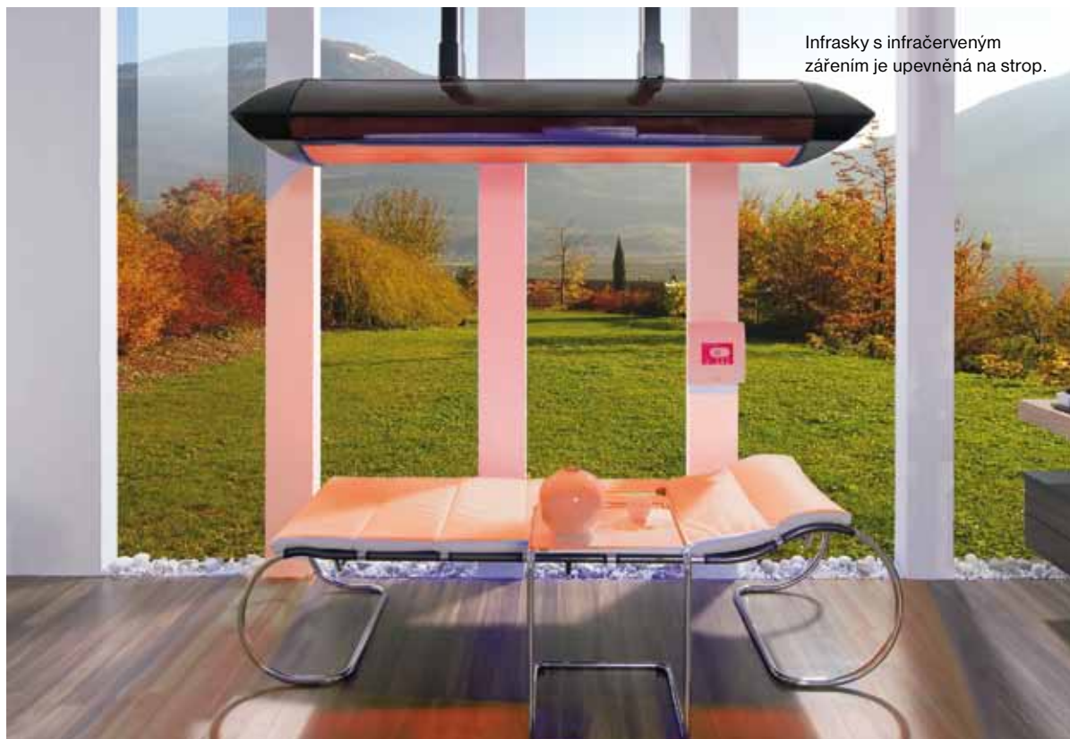
Infrasky s infračerveným zářením je upevněná na strop.