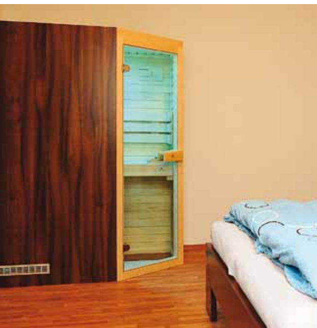
Model Mini potřebuje pouze trochu místa navíc a zásuvku.